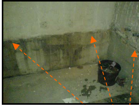
Ungefähre Verteilung der Niveaudübel.

Merke: OK Badewanne sollte sich etwa bei 550mm - 600mm befinden.